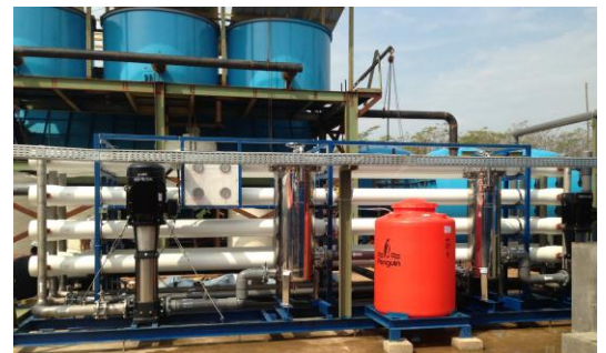
PT BERKAH MANIS MAKMUR – BALARAJA Year construction : 2012 Capacity : 60 m 3 /hour