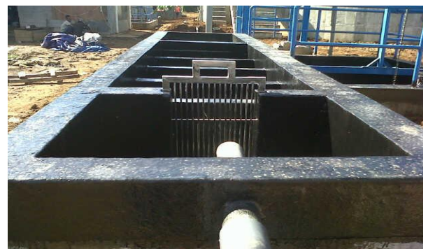
CS2 Pola Sehat - Sukabumi Bar Screen

Bar screen adalah coarse screen atau saringan kasar dengan jarak antara jeruji sebesar 10-20 mm (bar spacing) digunakan untuk menyaring padatan dengan diameter > 1 cm. Bar screen akan mencegah padatan seperti kayu, karet, plastik, kaleng, dll masuk kedalam mesin pengolahan air.