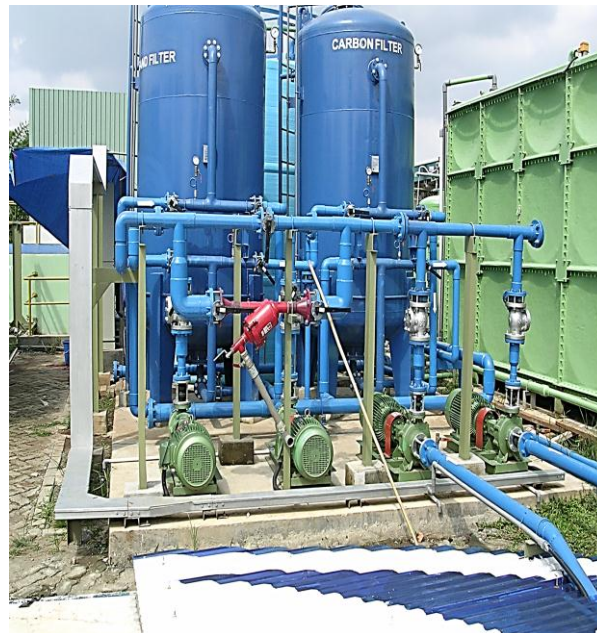
PT. Chemco Harapan Nusantara - Cikarang Carbon & Sand Filter Year construction: 2008 Capacity : 5 m 3 /hour

Adalah saringan air yang menggunakan pasir silika atau kuarsa dan gravel sebagai media penyaringannya. Saringan pasir sangat efektif untuk menyaring kotoran-kotoran yang tersuspensi dan kasat mata dan dapat menurunkan kekeruhan atau turbidity sampai kurang dari 1 NTU. Besaran butiran pasir silika yang paling halus digunakan untuk menyaring adalah 1 mm. Efektifitas penyaringan sand filter adalah \pm 50 micrometers.