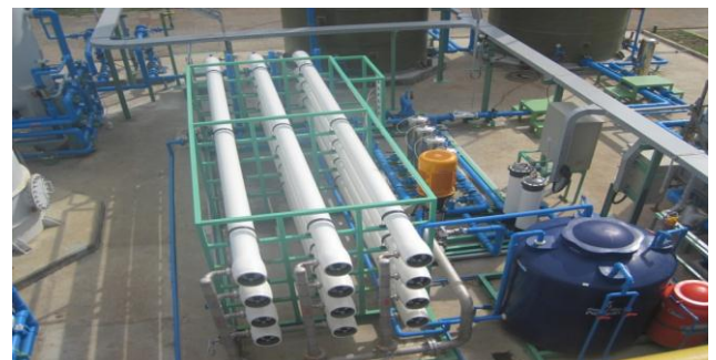
PT ASAHIMAS CHEMICALS (ASC) - CILEGON Year of construction :2011 Capacity : 56 m 3 /hour

Penyaringan dengan RO akan menghasilkan air yang murni serta bebas virus dan bakteri. RO berfungsi juga sebagai demineralizer untuk mengurangi kadar TDS sampai dengan 97 – 98 % dan pemurnian air.