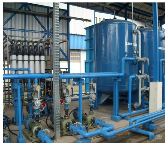
PT CHEMCO HARAPAN NUSANTARA - KARAWANG Year of construction : 2010 Capacity : 500 m 3 /day