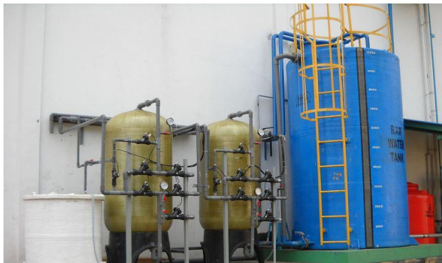
PT INDOFOOD – PADALARANG

Media dari water softener adalah resin cation exchanger yang dapat menyaring cation seperti \text{Ca}^{2+} (calcium), \text{Mg}^{2+} (magnesium) dan cation lainnya. Kadar \text{CaCO}_3 dan \text{MgCO}_3 didalam air menandakan kesadahan atau “ hardnes ”. Kadar \text{CaCO}_3 dan \text{MgCO}_3 yang tinggi dan melampaui batas akan menimbulkan kerak pada dinding boiler apabila air tersebut digunakan sebagai umpan boiler atau air proses (proses water). Water softener berfungsi untuk menurunkan kadar kesadahan atau “ hardness ”.