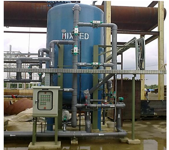
PT BERKAH MANIS MAKMUR – BALARAJA Year construction : 2012 Capacity : 60 m 3 /hour

UF pada umumnya juga dipakai sebagai pre-filter untuk seawater reverse osmosis (SWRO) atau proses desalinasi.